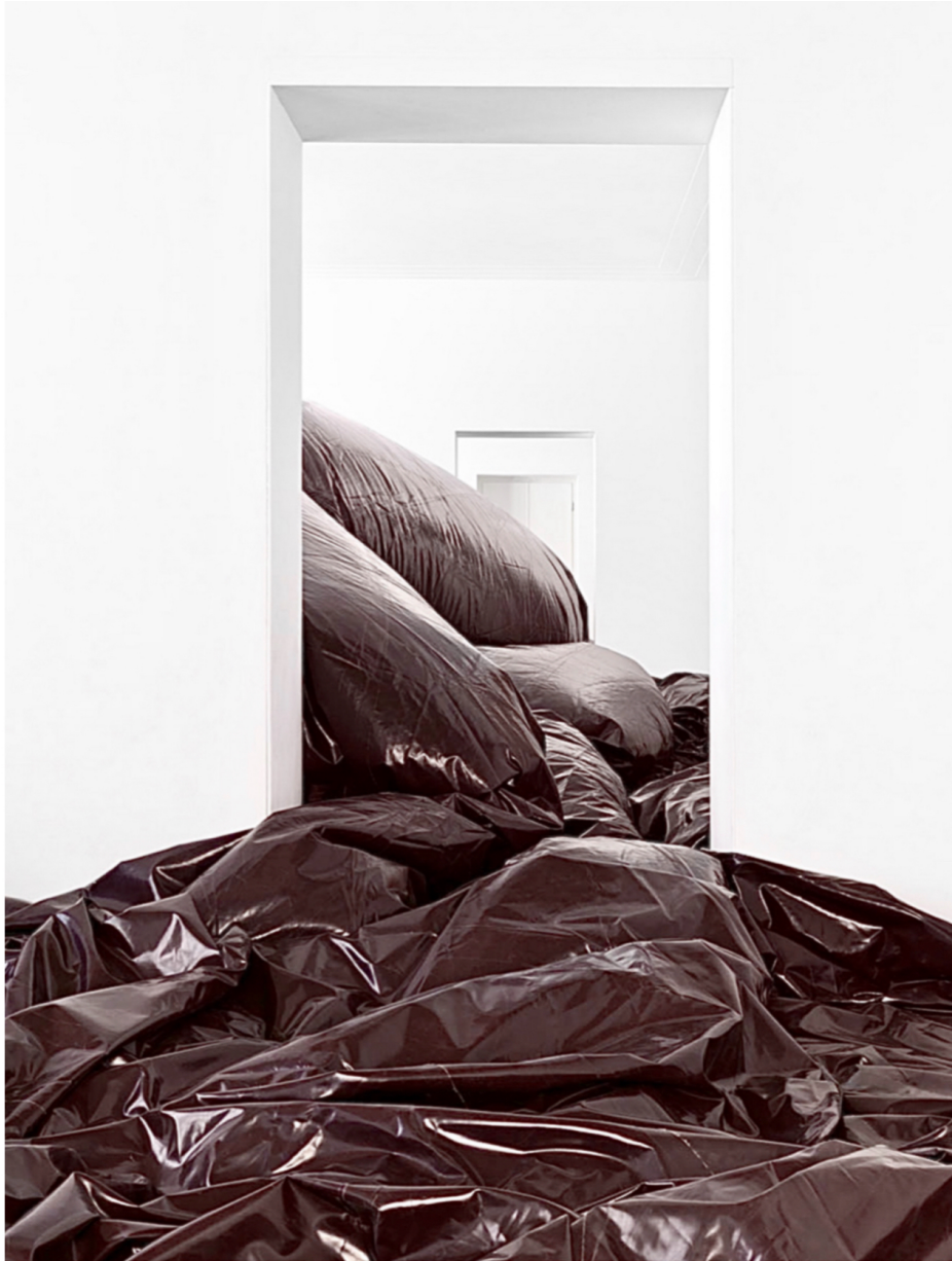
ANISH KAPOOR: DEATH OF LEVIATHAN