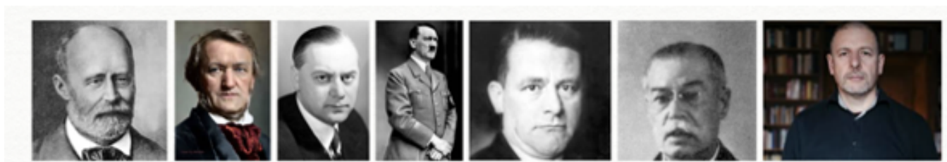
Lagarde Wagner Rosenberg Hitler Schmitt Claß Kubitschek