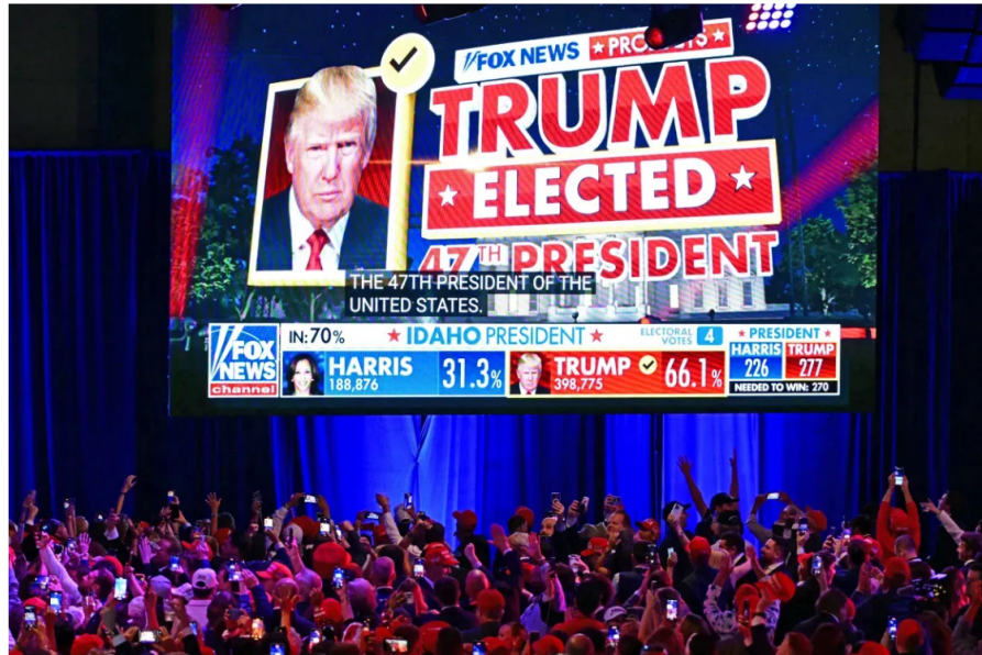
Jim Watson, AFP