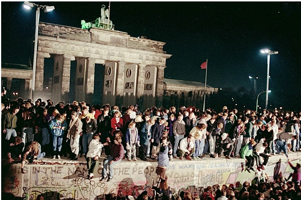
Deutsche Revolution 9. November 1989

Stattdessen kam es zum Beitritt der DDR. Eine abstruse Irreführung angesichts des gewünschten schönen gesamtdeutschen Bildes von gleichberechtigter Partnerschaft: Es ging vor 40 Jahren nicht um Gleichbehandlung und Partnerschaft, sondern um Unterwerfung. In Wahrheit ist bei der „Wiedervereinigung“ beider Staaten nichts anderes herausgekommen als die westdeutsche Kolonisierung der DDR, ein geschicktes „Schnäppchen namens DDR“, wie das Günter Grass zutreffend nennt. 40