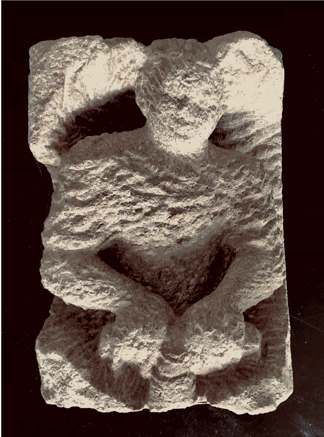
Guillermo Steinbrüggen, Bohren dicker Bretter, Granit 2008