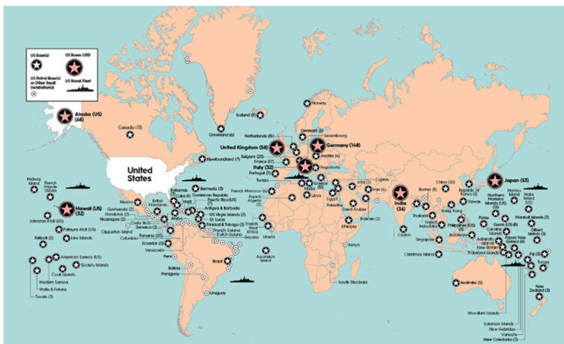
U.S. military presence around the World