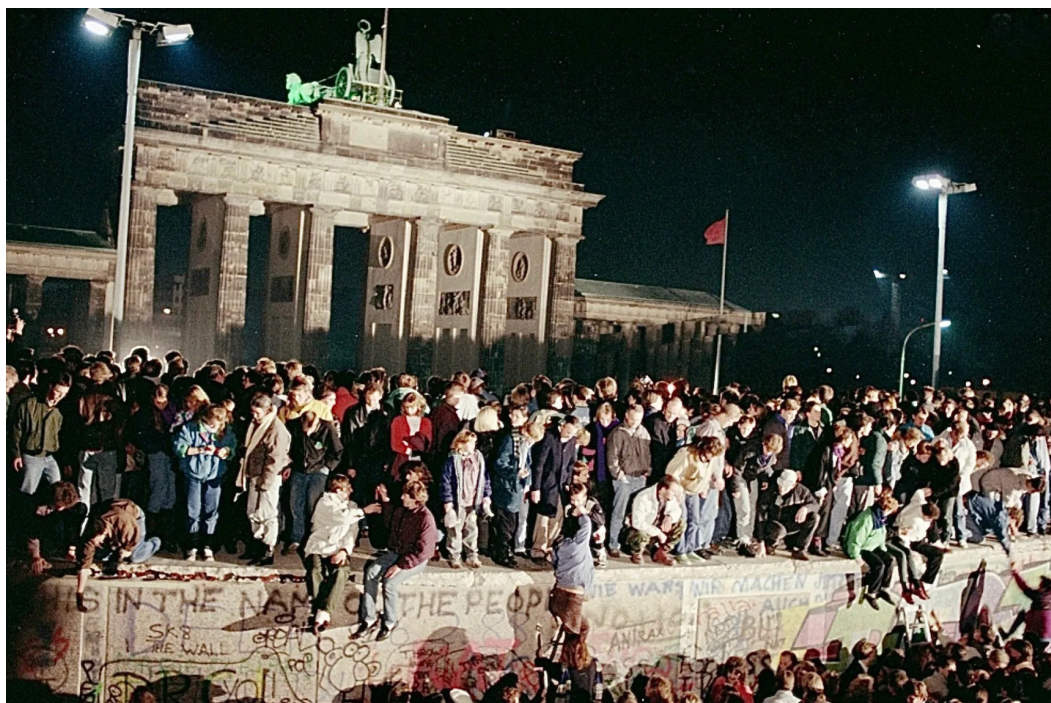
Deutsche Revolution 9.November 1989

Stattdessen kam es zum Beitritt der DDR. Eine abstruse Irreführung angesichts des gewünschten schönen gesamtdeutschen Bildes von gleichberechtigter Partnerschaft: Es ging vor 40 Jahren nicht um Gleichbehandlung und Partnerschaft, sondern um Unterwerfung. In Wahrheit ist bei der „Wiedervereinigung“ beider Staaten nichts anderes herausgekommen als die westdeutsche Kolonisierung der DDR, ein geschicktes „Schnäppchen namens DDR“, wie das Günter Grass zutreffend nennt. 40